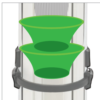
FILTRARE DUAL CICLONICĂ DUAL CYCLONE