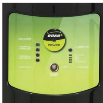
PANOU DE CONTROL CHECK PANEL