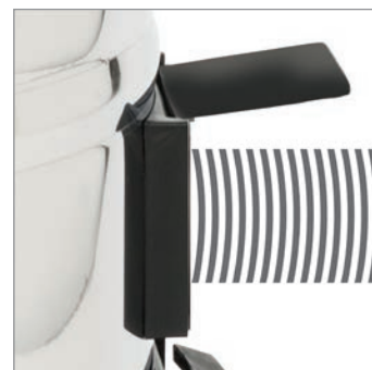
PRIZĂ DE UTILITATE INLET ON BOARD *doar pentru utilizare fără sac