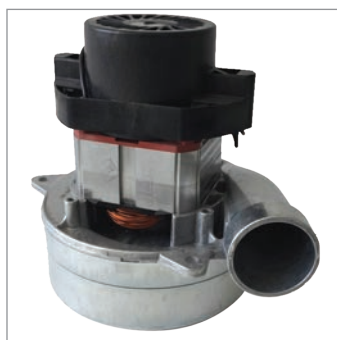
MOTOARE BYPASS BYPASS PAGODA MOTOR